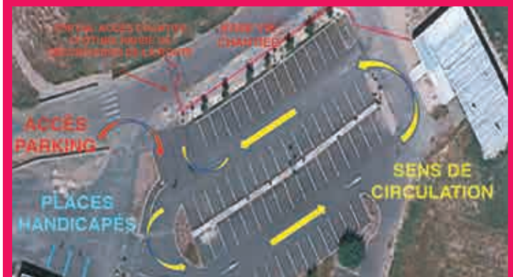
Accès et sens de circulation, parking de l'école maternelle