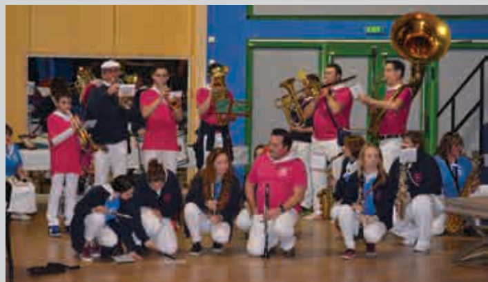
Gala de Solidarité le vendredi 17 février, animation musicale Band'à l'envers.