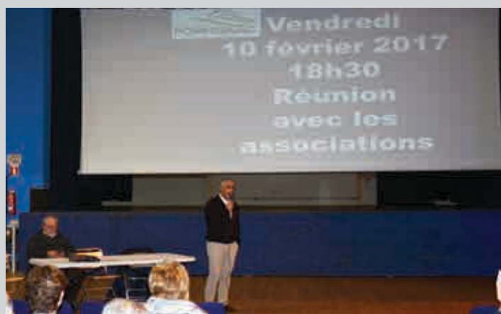
Réunion-débat du 10 février sur le fonctionnement associatif communal