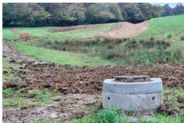
Vallon de la Capéranie : bassin de rétention et noue.

Ce projet a nécessité près de deux ans de travail et un dépôt de dossier d'autorisation auprès des services de la Préfecture. Une étude faune/flore a dû être réalisée démontrant l'existence d'une zone humide au droit du 3 ème bassin. Ce dernier devra être conservé en l'état, afin de préserver la biodiversité qui s'y est spontanément développée. Il ne participera donc