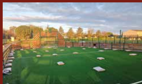
et après les travaux...