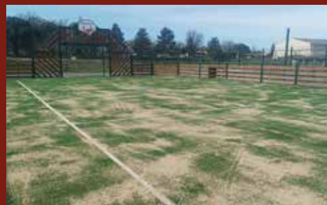
Le city stade avant...

Coût total de l'opération : 22 300 € TTC.