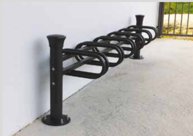
Le nouveau râtelier installé devant l'école maternelle pour garer son vélo facilement.