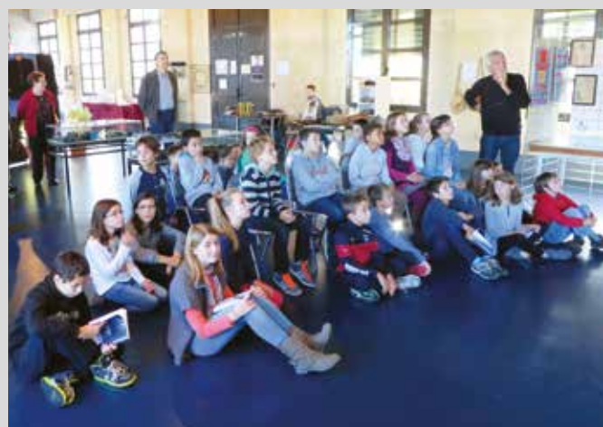
Classe de CM2 à l'exposition des poilus à Bègles.