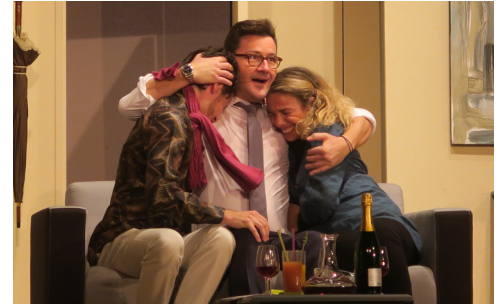
Théâtre p. 14-15