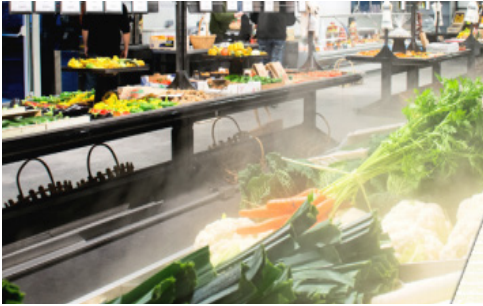
De nouveaux services p. 4