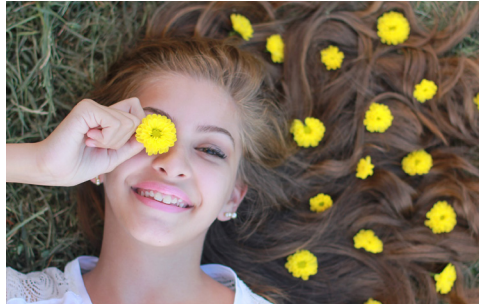
Vacances scolaires p. 12-13