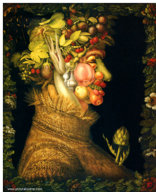
Giuseppe Arcimboldo, L'Été , 1563