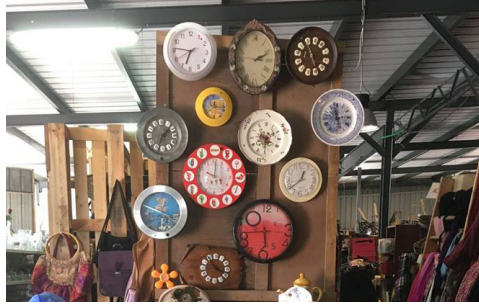
Recyclerie Rizibizi et ses ateliers p. 5