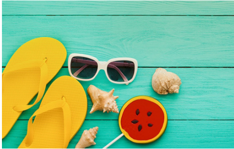
Nos conseils pour l'été p. 4-5

MAGAZINE MUNICIPAL N° 42 - Juil-Août 2018