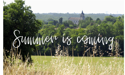
Les activités estivales p. 12-15