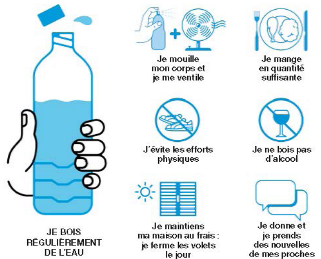
Les bons réflexes