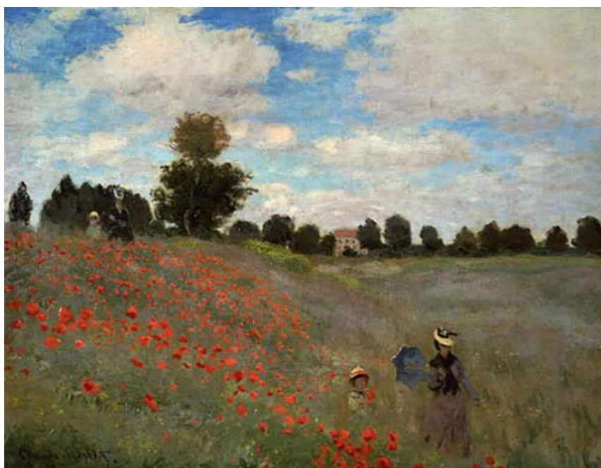
Claude Monet, Les Coquelicots , 1873