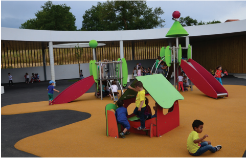
Réforme des rythmes scolaires p. 6-7