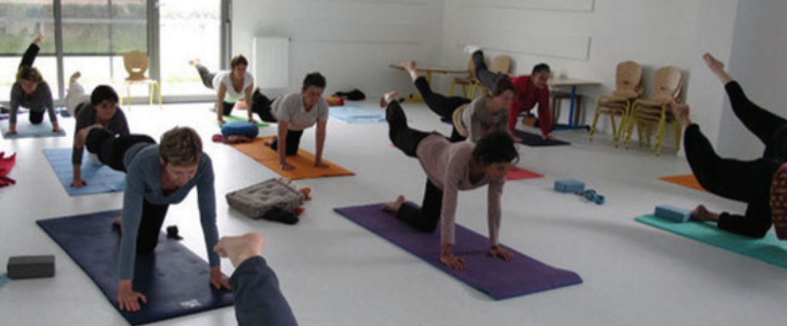
Cours de Yoga avec l'association Le Chant du Vivant