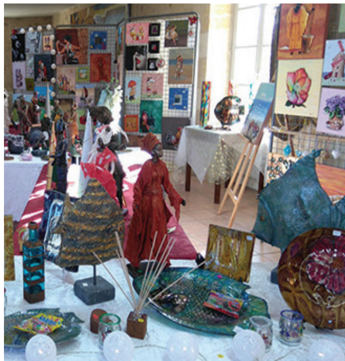
Exposition des travaux des membres de l'association au Forum des associations de Pompignac

07 77 38 48 74 ou par mail anita.lesateliersd-isa@orange.fr www.les-ateliers-disa.e-monsite.com