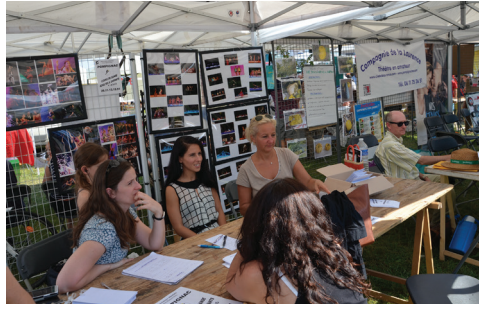
Foire de Pompignac, Défi sport p. 10-11