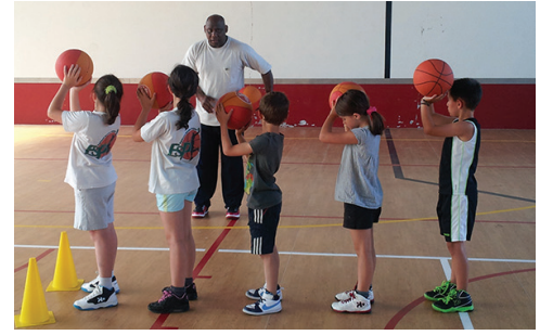
Dossier : la rentrée des assos p. 19-27