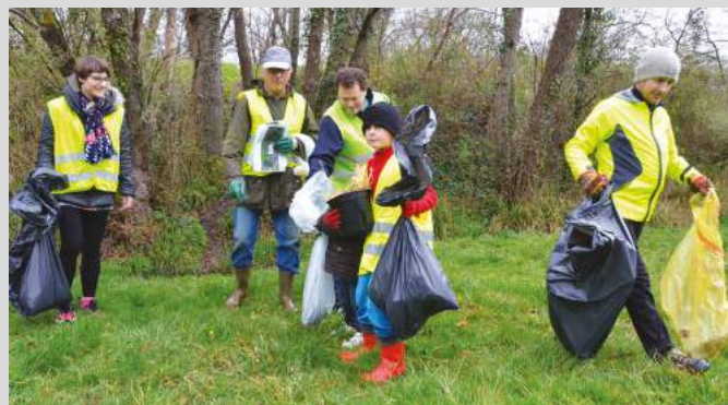
Samedi 28 mars : grand nettoyage de printemps intercommunautaire : plusieurs tonnes de déchets collectés.