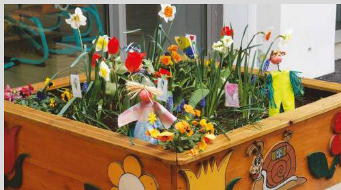
Le printemps fleurit au TAP jardin !