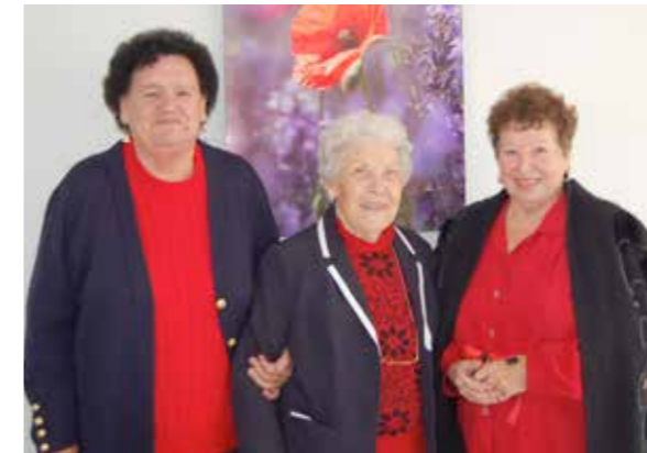
Les trois copines, toujours souriantes, du Village Automnal.

Depuis août 2014, la résidence pour personnes âgées Le Village Automnal, chemin de Saint-Paul, a ouvert ses portes et accueilli ses premiers résidents, résidentes en l'occurrence. Située en plein cœur du bourg de Pompignac, la résidence pour seniors offre tous les atouts d'une retraite paisible, avec un gardien présent 24h/24h, un partenariat avec la pharmacie de Pompignac (les résidents peuvent se faire livrer les médicaments ou demander au gardien d'aller les chercher au besoin), des activités et une salle commune où ils peuvent se rencontrer et échanger.