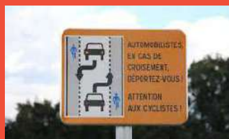
Chaussée à voie centrale banalisée et véloroute

Les aménagements de voirie débuteront en 2023. Ainsi, la route de Touty deviendra majoritairement une voie à chaussée centrale banalisée. La route de l'église et le chemin des Carmes seront de type véloroute. Une zone 30 et une zone de rencontre seront créées en cœur de bourg pour sécuriser les cheminements doux. Une réunion d'information sera programmée avant l'été.